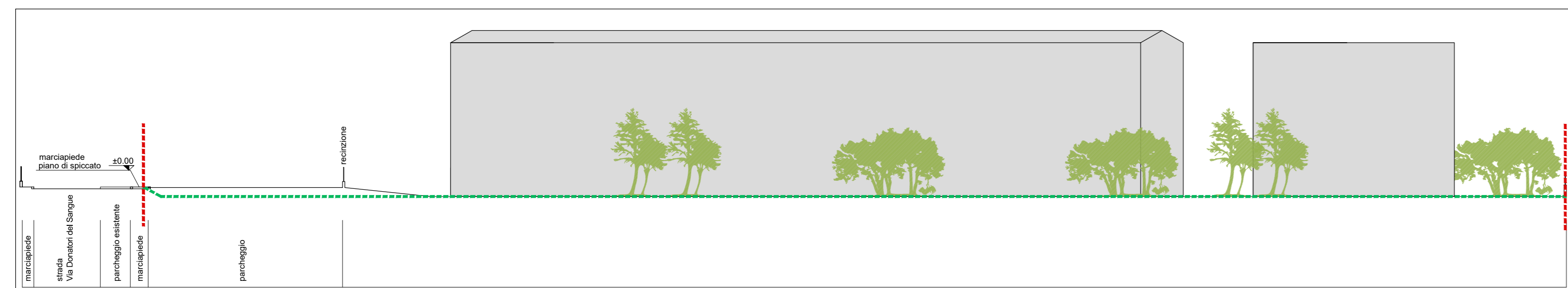
PROFILO SEZIONE BB_PROGETTO