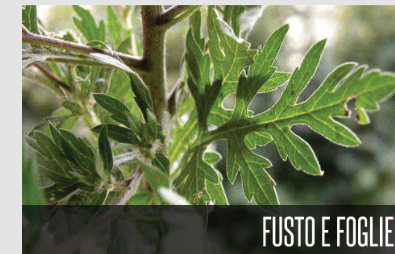
FUSTO E FOGLIE